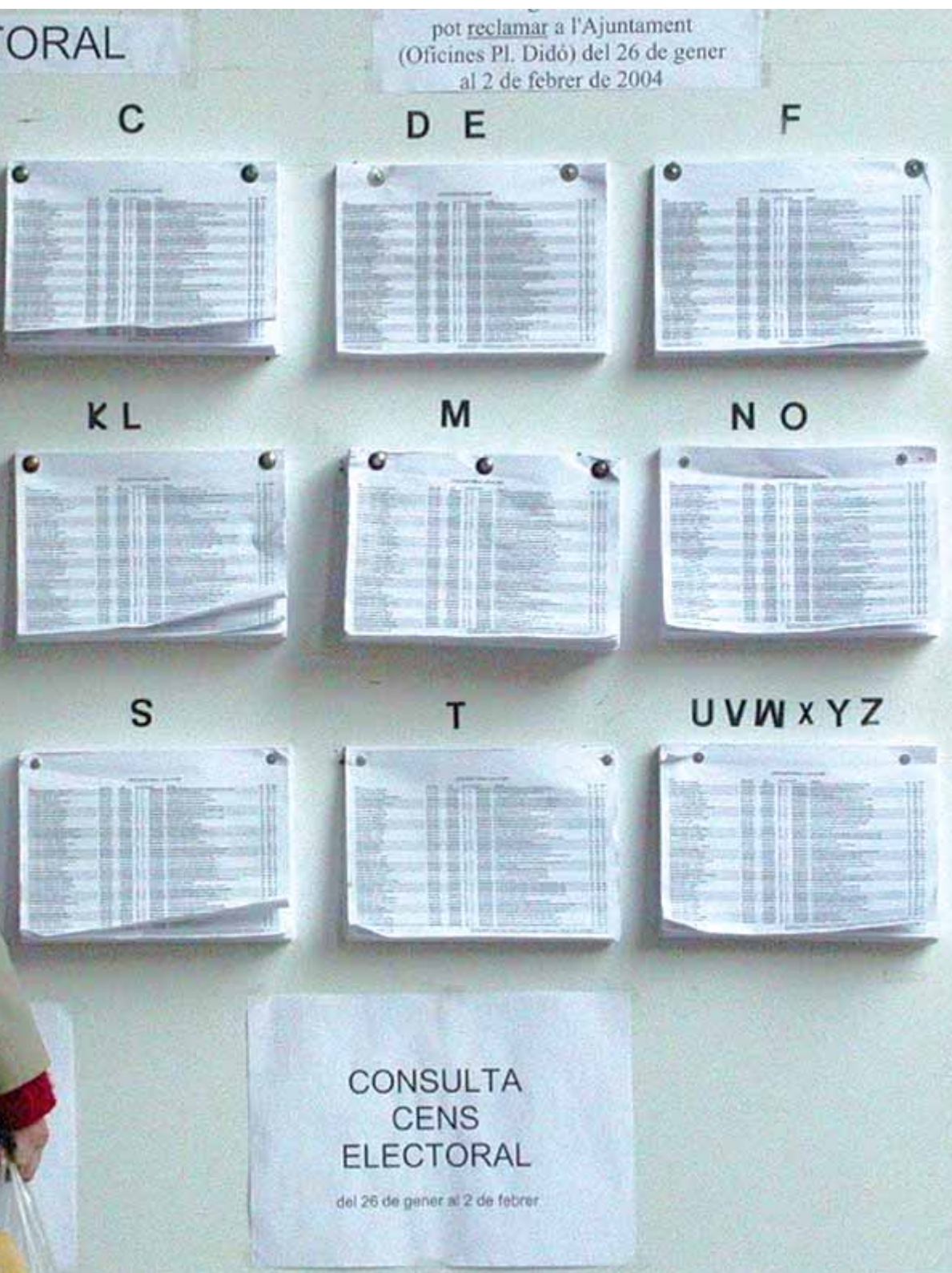
Una dona consulta els llistats del cens electoral. A sota, escultura romana amb el nom d'August. OSCAR ESPINOSA